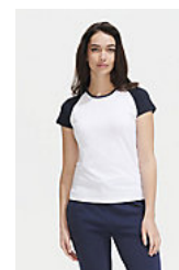
SOL'S MILKY 11195